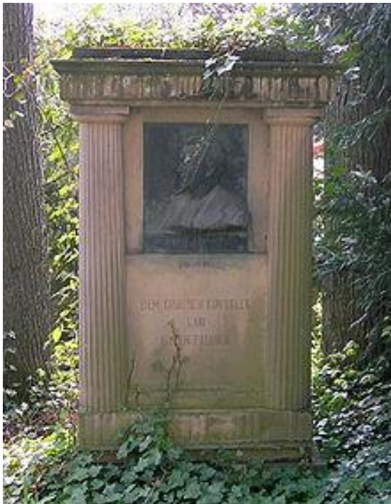
Tumba de August Bungert

Durante este tiempo, se consideró que Bungert era la antítesis de Wagner en los mitos usados: las obras de Wagner extraían temas de la mitología nórdica, mientras que los libretos de Bungert estaban influenciados por los clásicos griegos. Bungert estuvo fuertemente influenciado por Wagner y planeó construir un teatro al estilo de Bayreuth en Bad Godesberg.