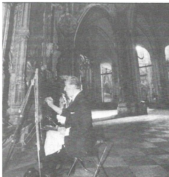
Pintant la Catedral de Burgos