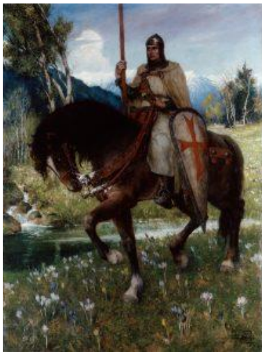
Ferdinand Leeke Parsifal, 1912

https://richard-wagner-web-museum.com/publications/parsifal-et-la-culpabilite/