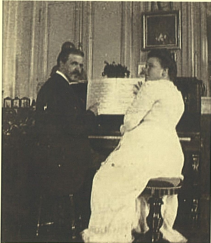
Blanche Selva et Vincent d'Indy

A París, que la reconeixen com artista pròpia, s'ha creat l' Associació Blanca Selva , dedicada a preservar la seva obra, que és considerable, si bé malauradament bona part de la seva producció s'ha perdut. Com a compositora va ser molt prolífica, dominava la harmonia, el contrapunt i els diferents estils musicals. Va escriure obres per a piano/orgue: Paysage au soleil couchant (1904), Suite per a piano, (Perduda) Cloches dans la brume , Cloches au soleil , Pièces pour piano , Petite pièce , 9 peces per a piano (1931): Records i entremaliadures , ostra i cargols , Processons de formigues , canyes i oreig , núvols , a la muntanya , primers freds , mati de tardor , ulls clars , ànima recta pau el cel , Primers jocs , Le jeu du pentacorde qui vol , (1940); Obres per a piano/armonium i veu: