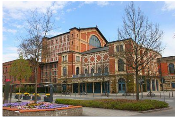
Vista actual del Festspielhaus.

Victòria dels Àngels canta d'una manera celestial la seva sortida i des d'aquest moment encanta al públic. No n'hi ha res en el món tan fervorós com l'aplaudiment, que distingeix als artistes i premia en ells la seva vinculació a Bayreuth. Perquè ho sé, perquè he advertit el que suposa per als