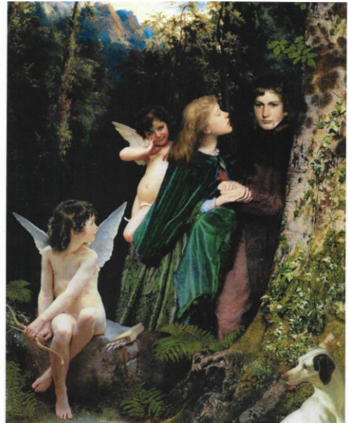
El ángel de la Guarda

También hay algunos temas religiosos impactantes, tanto desde una perspectiva pagana como cristiana. Ha sido muy productivo en los últimos años y ha logrado hacer ilustraciones detalladas para los principales temas de la mitología griega, celta y nórdica, además de leyendas artúricas y elementos de otras mitologías, todo incluido en su web. Además, David tiene muestras extensas de sus ilustraciones de hadas y cuentos de hadas incluidas, así como artículos sobre su técnica y algunos de sus temas e incluso un conjunto de lecciones de arte breves para principiantes.