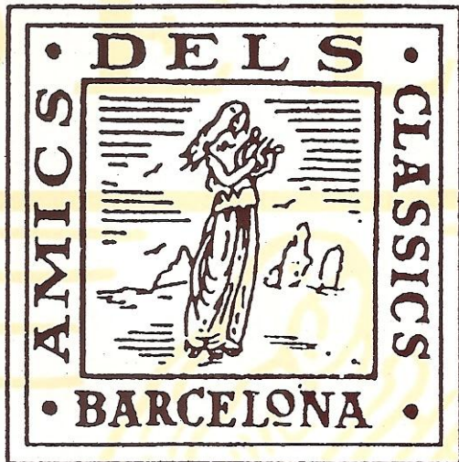
Logotip actual de l'Associació Amics dels Clàssics

durant més de 70 anys... tota la vida! I és que es diu aviat, però 70 anys, és molt de temps per a mantenir una formació orquestral amb músics, organitzar concerts, triar i assajar tantes obres, estrenar-ne moltes, superar els obstacles i fer-se estimar.