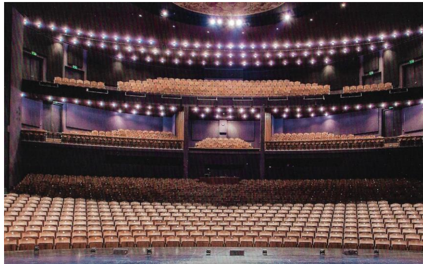
Vista de l'interior del Teatre, des de l'escenari